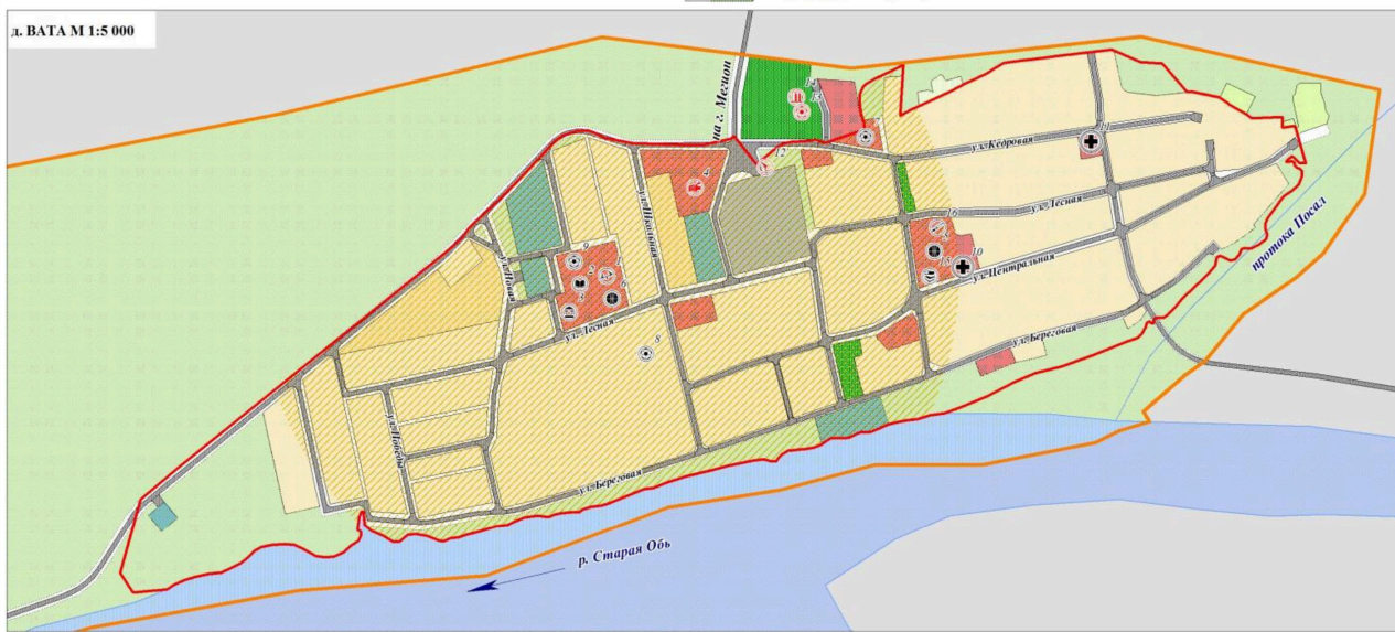
д. ВАТА М 1:5 000

Размещение объектов в области физической культуры и спорта, культуры и искусства соответствует предельным значениям максимально допустимого уровня транспортной доступности.