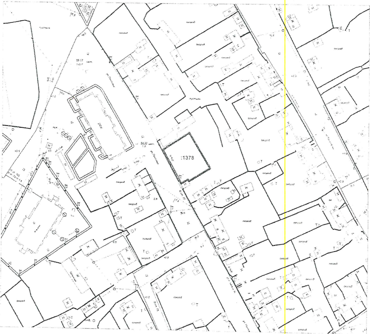
п. Зайцева Речка, ул. Почтовая, 8, кадастровый номер 86:04:0000023:1378.